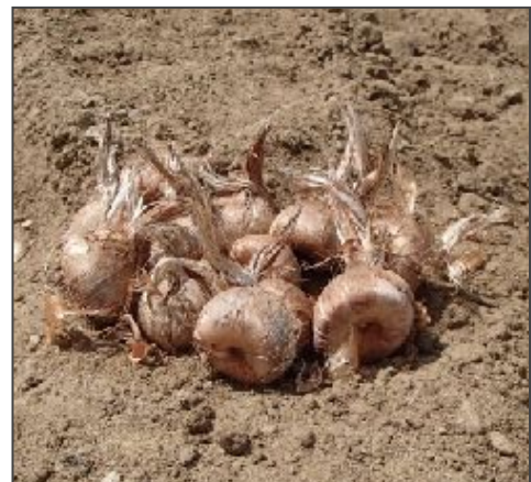
Cormes de Crocus sativus

Cette plante vénérée par de nombreux peuples a aussi inspiré des élixirs d'immortalité , notamment l'élixir de Paracelse, du nom du savant vagabond du 16 e siècle.